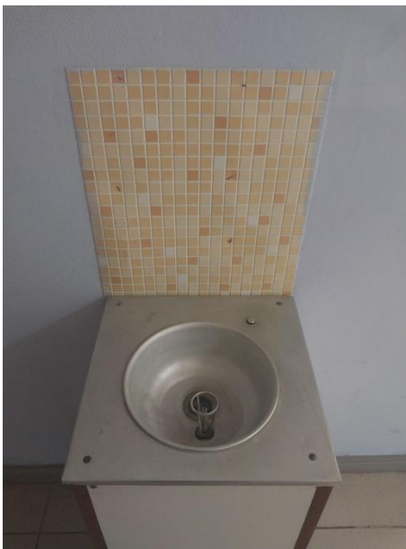
36. Фото «Наличие и доступность санитарно-гигиенических помещений» (фото размещается только при заявлении показателя в справке)